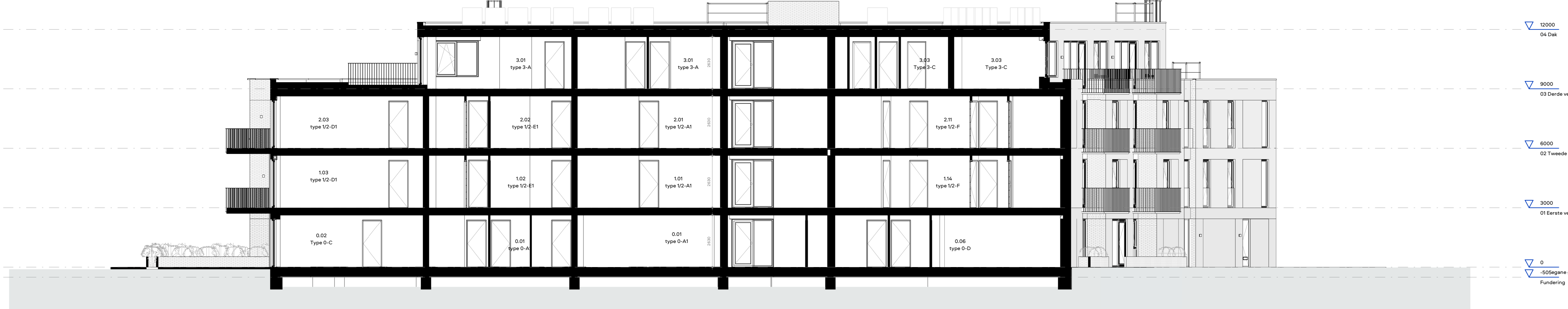
Doorsnede A schaal 1:100