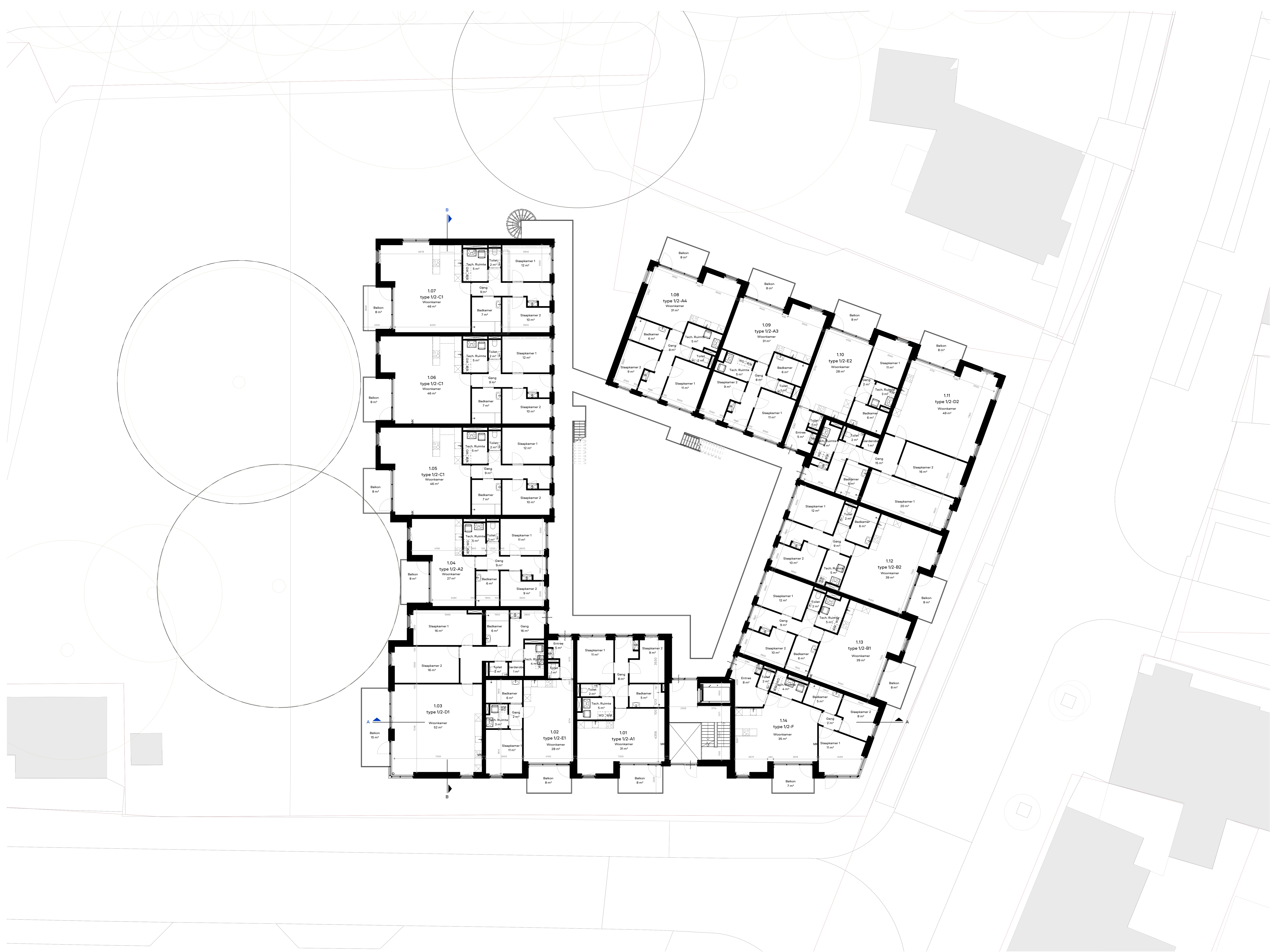
Eerste verdieping schaal 1:100